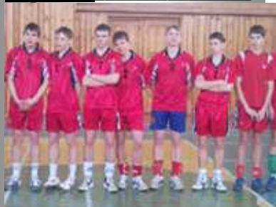
Волейбол, I место