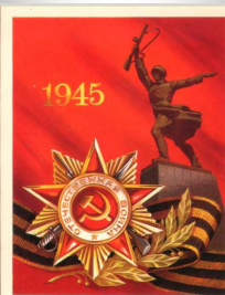
С ПРАЗДНИКОМ ПОБЕДЫ!