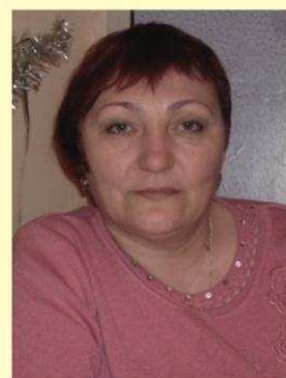
Воспитатели и Совет общежития № 1.