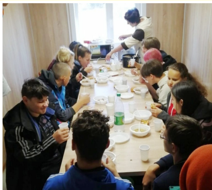
Студенческое самоуправление ГАПОУ БТОТиС