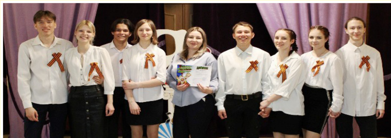
Студенческое самоуправление ГАПОУ БТОТиС