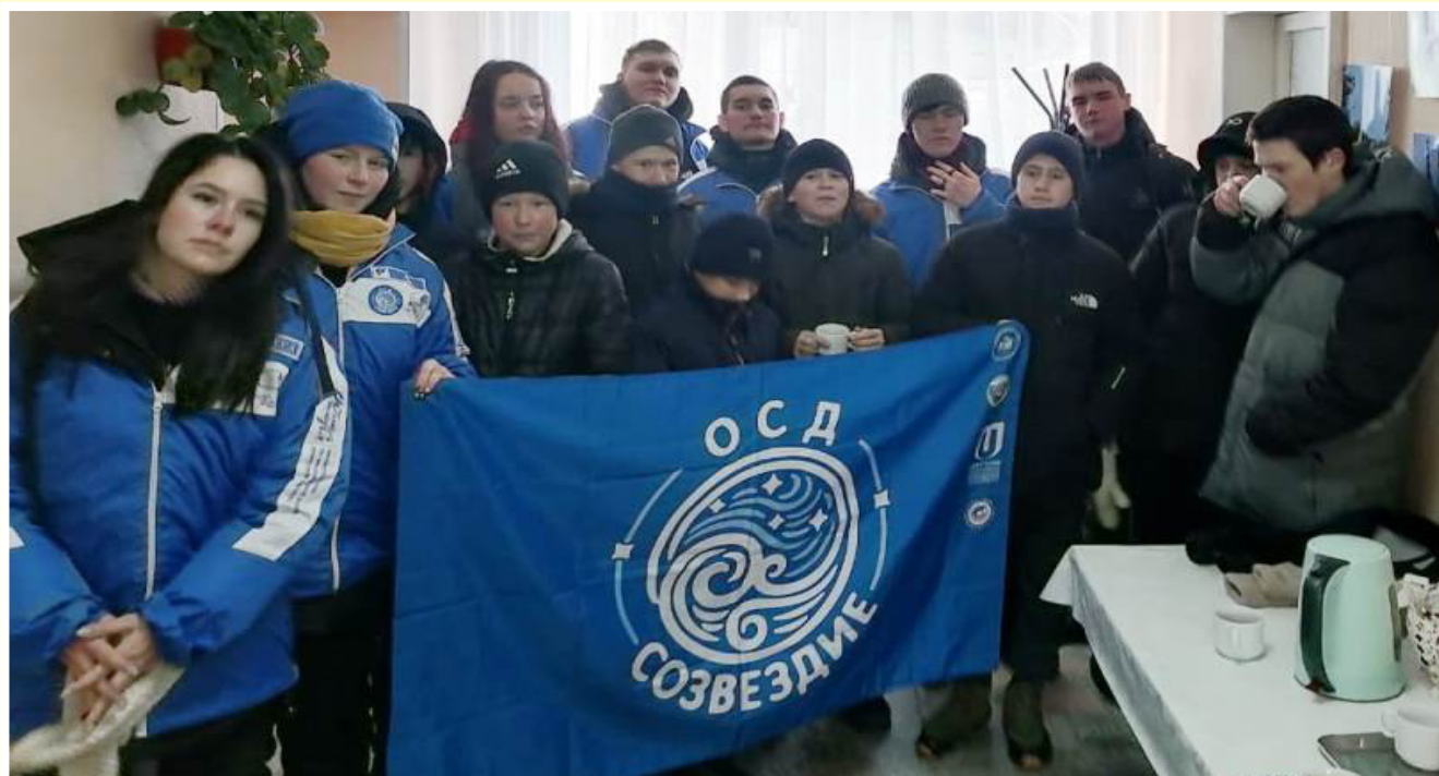
Студенческое самоуправление ГАПОУ БТОТИС