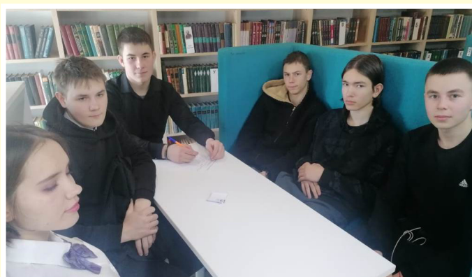
Студенческое самоуправление ГАПОУ БТОТИС