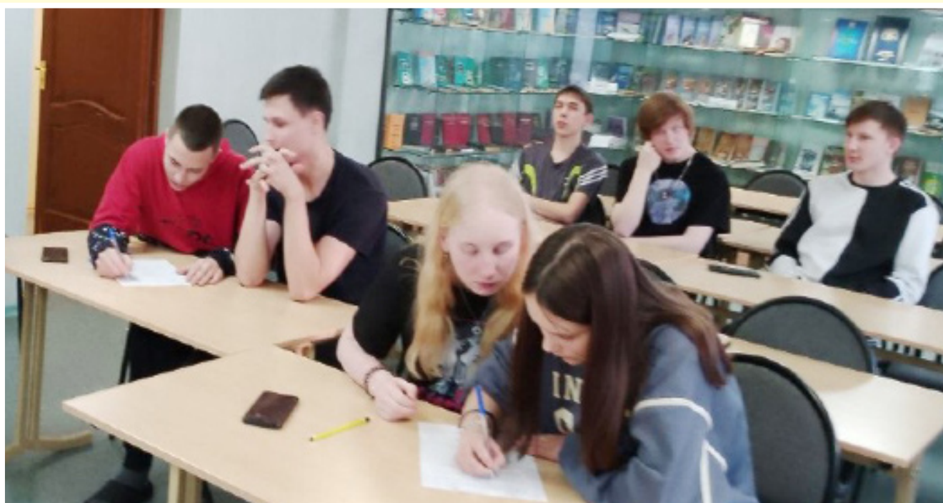
Студенческое самоуправление ГАПОУ БТОТиС

ворки, придумывали умные и остроумные синонимы к различным словам, а также активно обсуждали вопросы, связанные с грамматикой и лексикой. Участие в конкурсе стало не только интересным и занимательным занятием, но и отличным способом проверить и улучшить знания русского языка. Мы благодарим студентов за участие в конкурсе, а также поздравляем с успешным выступлением и желаем им дальнейших успехов в изучении родного языка.