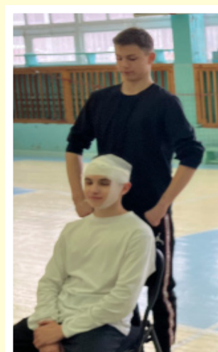
Студенческое самоуправление ГАПОУ БТОТиС