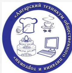
ГАПОУ ИО «Ангарский техникум общественного питания и торговли»