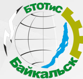
ГАПОУ «Байкальский техникум отраслевых технологий и сервиса»